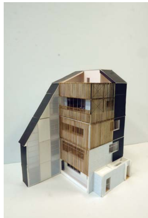
東側鳥瞰 竹炭のルーバーと、左官壁。史跡を囲む平面形状。